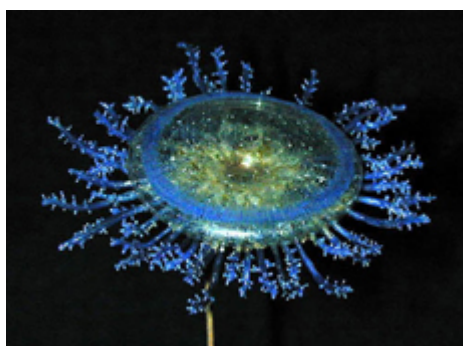
Blue Jelly (Qualle)